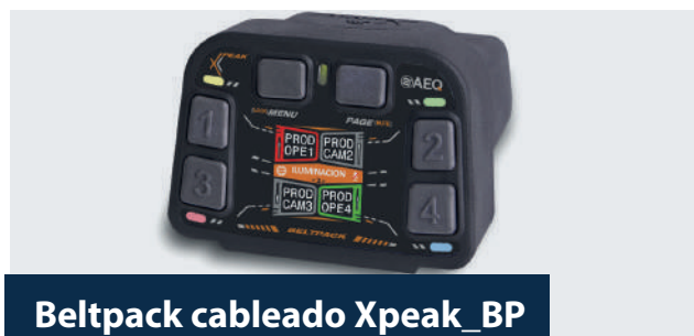
Beltpack cableado Xpeak_BP