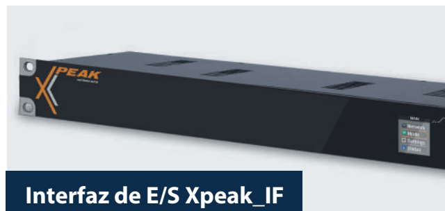
Interfaz de E/S Xpeak_IF