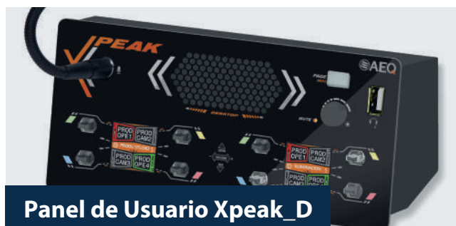
Panel de Usuario Xpeak_D