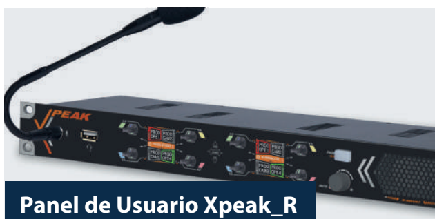
Panel de Usuario Xpeak_R