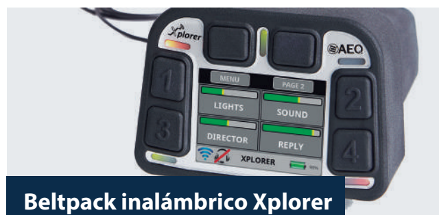
Beltpack inalámbrico Xplorer