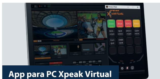
App para PC Xpeak Virtual