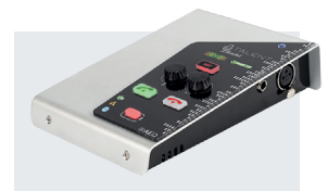
Familia de Audiocodex Phoenix